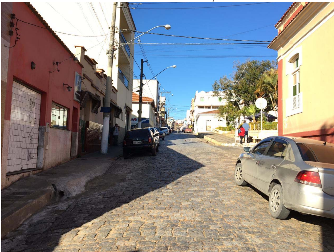
Foto 08 - Trecho Rua Pe. Inácio Kusk,16-07-2021