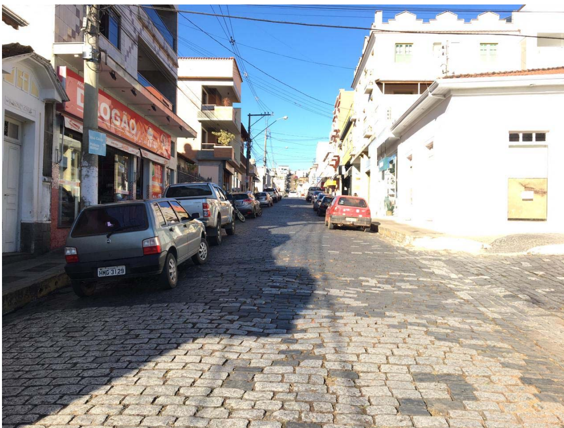
Foto 09 - Trecho Rua José Alberto Pelúcio, 16-07-2021