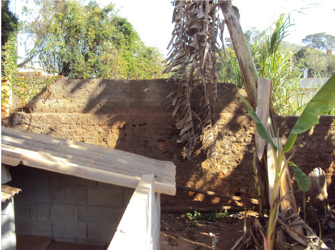
Foto 02 - Muro Confrontante Ribeirão, 16-07-2021