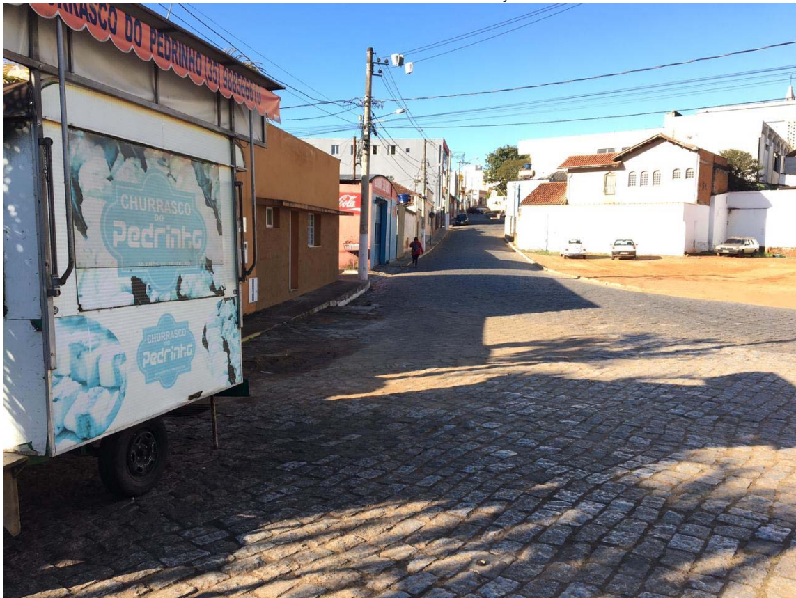
Foto 04 - Trecho Rua Pe. Inácio Kusk,16-07-2021