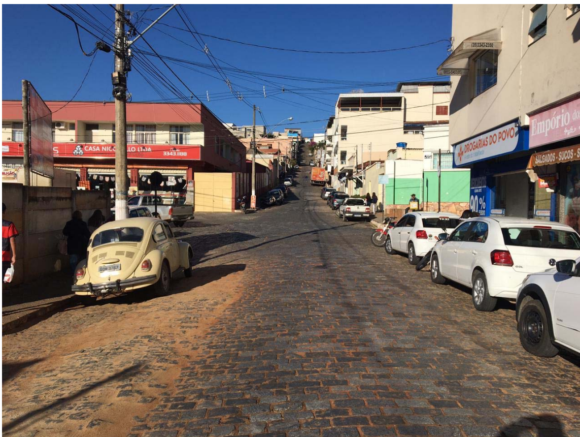
Foto 13 - Trecho Montante Rua José Alberto Pelúcio, 16-07-2021