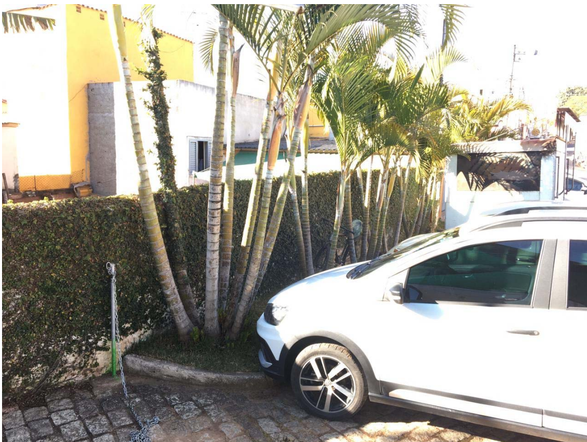
Foto 03 - Muro Confrontante Posto Gasolina, 16-07-2021