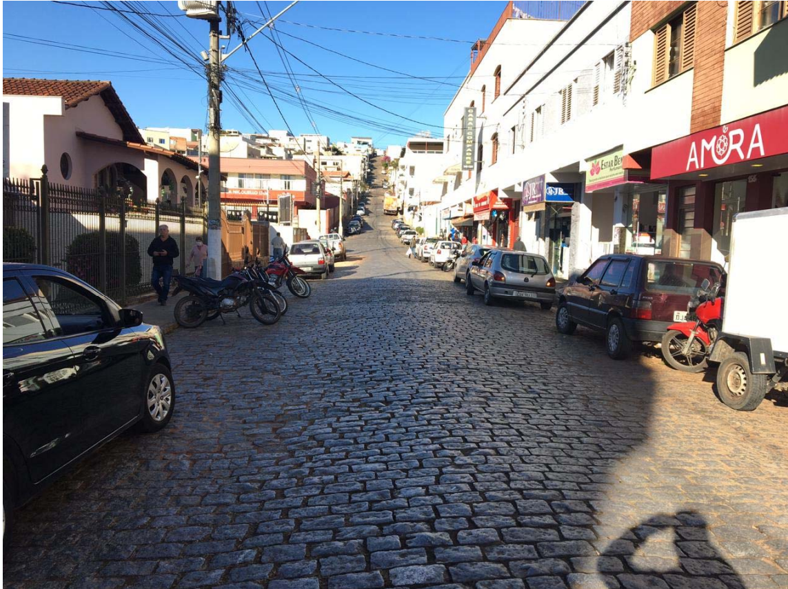
Foto 12 - Trecho Rua José Alberto Pelúcio, 16-07- 2021