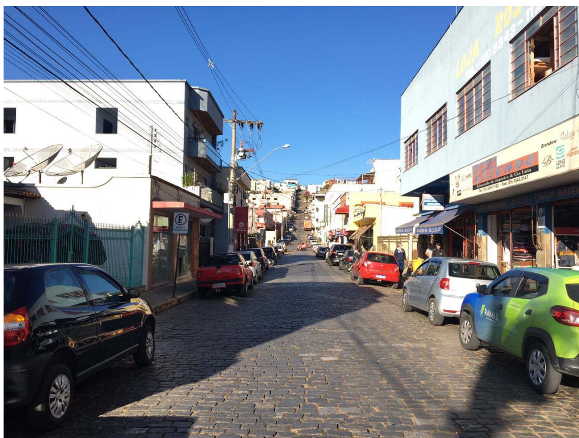
Foto 11 Trecho Rua José Alberto Pelúcio, 16-07-2021