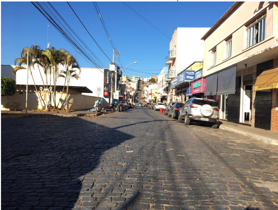
Foto 10 - Trecho Rua José Alberto Pelúcio, 16-07-2021